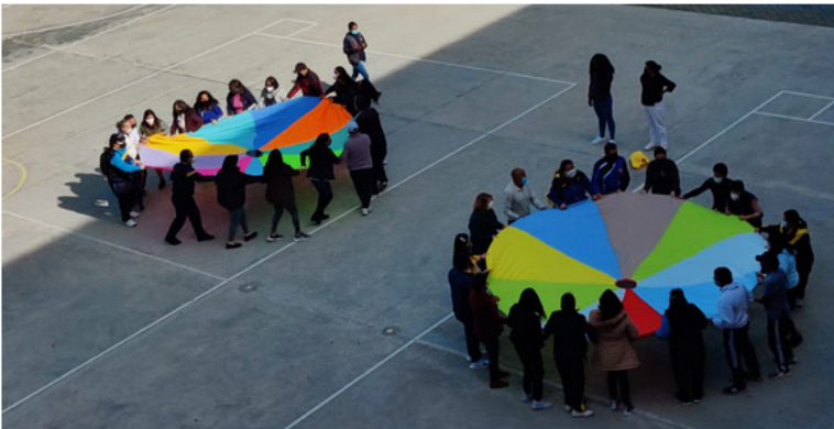
La dinámica del paracaídas fomenta el trabajo en equipo y la integración

Estos talleres que proporcionan a los docentes herramientas para dar apoyo psicosocial a las familias y sus comunidades, se venían realizando de manera virtual. Al pasar a la presencialidad, el entusiasmo y el compromiso de los docentes en las actividades denota el efecto positivo que tiene el retorno al aprendizaje en persona para la comunidad educativa.