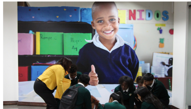
Estudiantes de la UE Luz y Vida