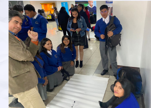
Estudiantes de la UE Fray Jodoco Ricke