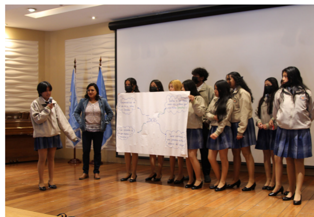
Presentación en plenaria de UE Instituto Nacional Mejía