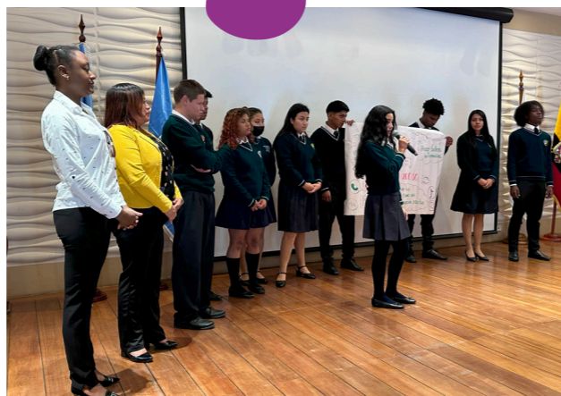
Presentación en plenaria de la UE Luz y Vida

Gracias a los aportes de las Unidades educativas presentes, este conversatorio ha sido un llamado a unirnos para juntos generar una sana convivencia escolar, dentro y fuera del aula.