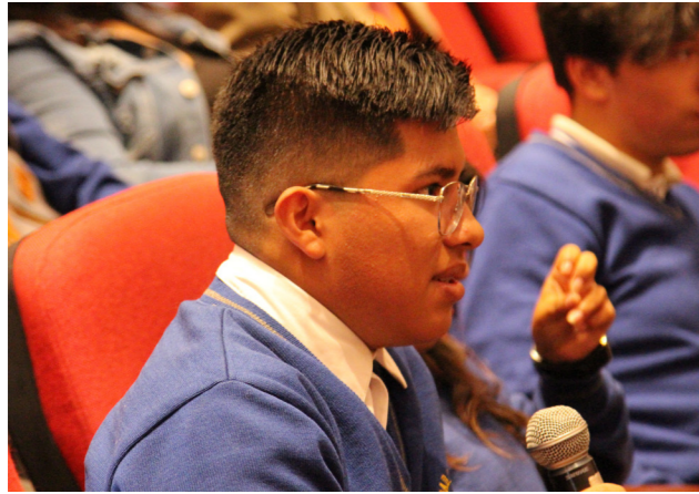
Ronda de preguntas y comentarios de los asistentes.