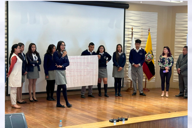
Presentación en plenaria de la UE Tumbaco

En este espacio se pudo constatar varias acciones comunes presentadas por las Unidades educativas como: la urgencia del desarrollo de campañas en las instituciones educativas sobre el acoso cibernético, la creación de círculos o redes en la que se considere la participación de jóvenes y adultos, la participación de la familia en las actividades digitales que los jóvenes realicen para poder brindar una mejor atención.