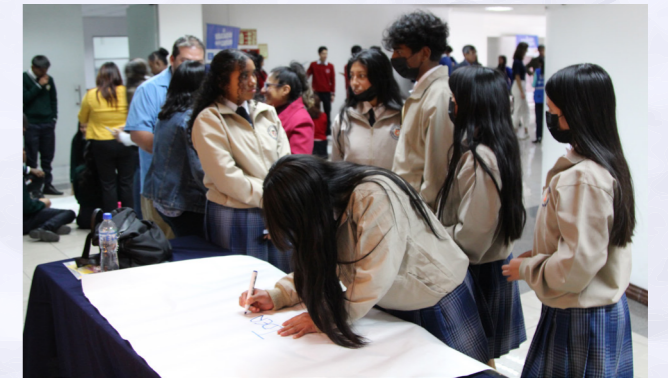
Estudiantes de UE Darío Guevara Mayorga

Con el título “IDEAS” esta institución educativa plasma cuatro acciones a considerar por los estudiantes al utilizar medios digitales: