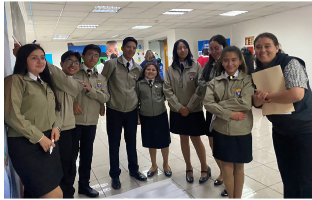
Estudiantes de la UE Instituto Nacional Mejía

El título de la propuesta de acciones a ejecutar en su unidad educativa fue “Medios de prevención del ciberacoso” destacando los siguientes llamados a la acción: