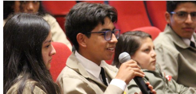
Ronda de preguntas y comentarios de los asistentes.

“Siendo virales” trata sobre uno de los temas más presentes en la sociedad actual: las redes sociales. Explica de manera fácil y entretenida, las formas que tienen los algoritmos de atraer a sus usuarios y de las maneras en las que podemos usarlas responsablemente y narra también el uso inadecuado de las redes, que pueden derivar en ciberacoso o acoso cibernético.