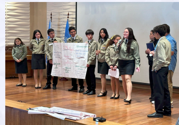
Presentación en plenaria de la UE Instituto Nacional Mejía.