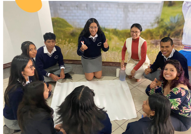
Estudiantes UE Tumbaco