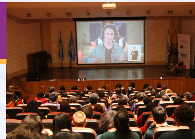
Proyección del video "Siendo Virales"

El objetivo del conversatorio fue reflexionar con los y las estudiantes, sobre el riesgo al que están expuestos en las redes sociales e invitarles a proponer acciones para prevenirlo, haciendo un llamado a la construcción de entornos de convivencia seguros.