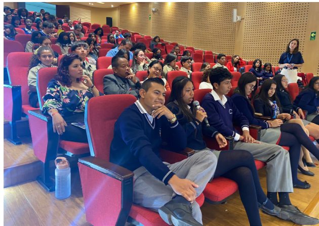
Ronda de preguntas y comentarios de los asistentes.

Durante esta actividad se tuvo una amplia participación de los y las estudiantes, quienes pudieron expresar su percepción frente a las redes sociales, el ciberacoso y otros tipos de extorsión y vulneraciones a las que se puede estar expuestos en redes. Se hizo un llamado a su correcto uso crítico y a estar alertas de las interacciones que pueden tener las personas que se encuentran tras la pantalla, haciendo la sugerencia de tener siempre un grupo de apoyo informado que puede estar conformado por adultos o pares a quienes puedan acudir en caso de sentirse en riesgo.